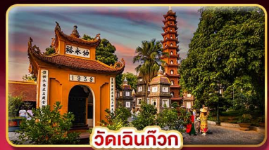
วัดเงินทิว