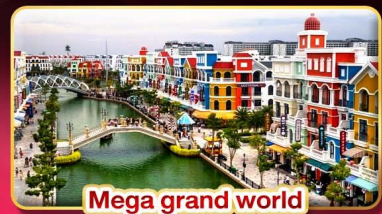
Mega grand world