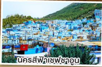
นครสีฟ้าเซฟซาอุน