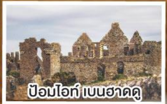
ป้อมโอท์ เบนฮาดดู