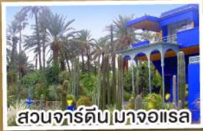
สวนจอร์ดีน มาจออแรล

เดินทาง 14-23 มี.ค. 68 23 เม.ย.-02 พ.ค. 68 02-11 พ.ค. 68