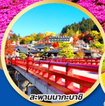
สะพานนาคะบาชิ