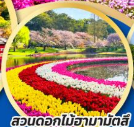
สวนดอกไม้ฮามามัตสึ