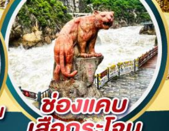
ช่องแคบ เสือกระโจน