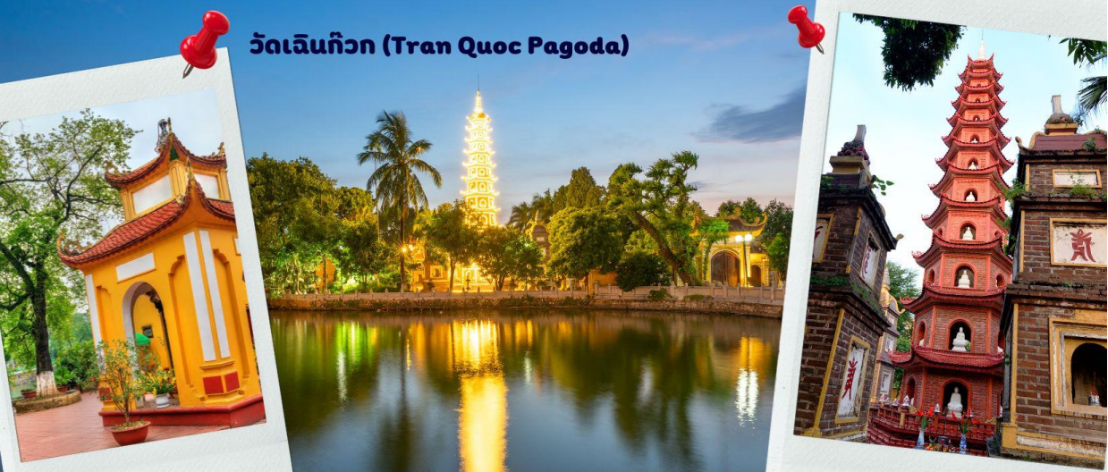
วัดเจินก๊วก (Tran Quoc Pagoda)

จากนั้นนำท่านไป วัดเจินก๊วก (Tran Quoc Pagoda) เป็นวัดที่อยู่ใจกลางเมืองของเวียดนาม ใกล้ชิดกับ ทะเลสาบตะวันตกของเมืองฮานอย สร้างด้วยสถาปัตยกรรมจีนโบราณ มีความร่มรื่น และบรรยากาศดี จึงเป็นที่นิยมของนักท่องเที่ยวทั้งที่ชื่นชอบความงามและมีศรัทธาในพระพุทธศาสนา จากภาพมุมสูงของสถานที่ตั้ง ที่นี้เหมือนตั้งอยู่บนเกาะที่ยื่นลงไปทะเลสาบ แต่มีเส้นทางคมนาคมเข้าถึงที่ สิ่งปลูกสร้างมีการวางผังเป็นอย่างดี ใช้สีสันทึกลับกมลในโทนสีเหลือง น้ำตาล ตัดกับสีเขียวของต้นไม้ใหญ่ที่โอบล้อมอยู่ในมุม ถ่ายภาพจากอีกฝั่งหนึ่ง จะเห็นสิ่งปลูกสร้างสไตล์จีน และเจดีย์หลายชั้นโดดเด่น มีภาพที่สะท้อนลงสู่ผืนน้ำ เป็นภูมิทัศน์ที่งดงามทั้งยามกลางวันและยามค่ำคืนที่มีการเปิดไฟส่องสว่าง