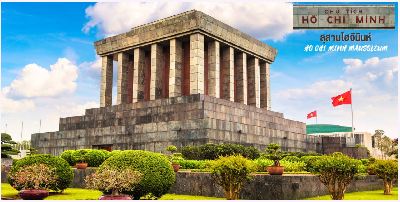
CHỦ TỊCH HỒ - CHI - MINH สุสานโฮจิมินห์ HO CHI MINH MAUSOLEUM

นำท่านถ่ายรูปด้านหน้า สุสานโฮจิมินห์ (HO CHI MINH MAUSOLEUM) ตั้งอยู่ที่จัตุรัสบาสติงห์ เคยเป็นที่ที่ลุงโฮได้อ่านคำประกาศอิสรภาพเวียดนามจากประเทศฝรั่งเศสต่อหน้าชาวเวียดนามที่มาชุมนุมกัน เมื่อวันที่ 02 กันยายน ค.ศ.1945 สุสานนี้สร้างด้วยหินอ่อน หินแกรนิตและไม้มีค่าจากทั่วประเทศ สร้างขึ้นเมื่อปี ค.ศ. 1973 หลังจากลุงโฮเสียชีวิต เมื่อวันที่ 02 กันยายน ค.ศ.1969