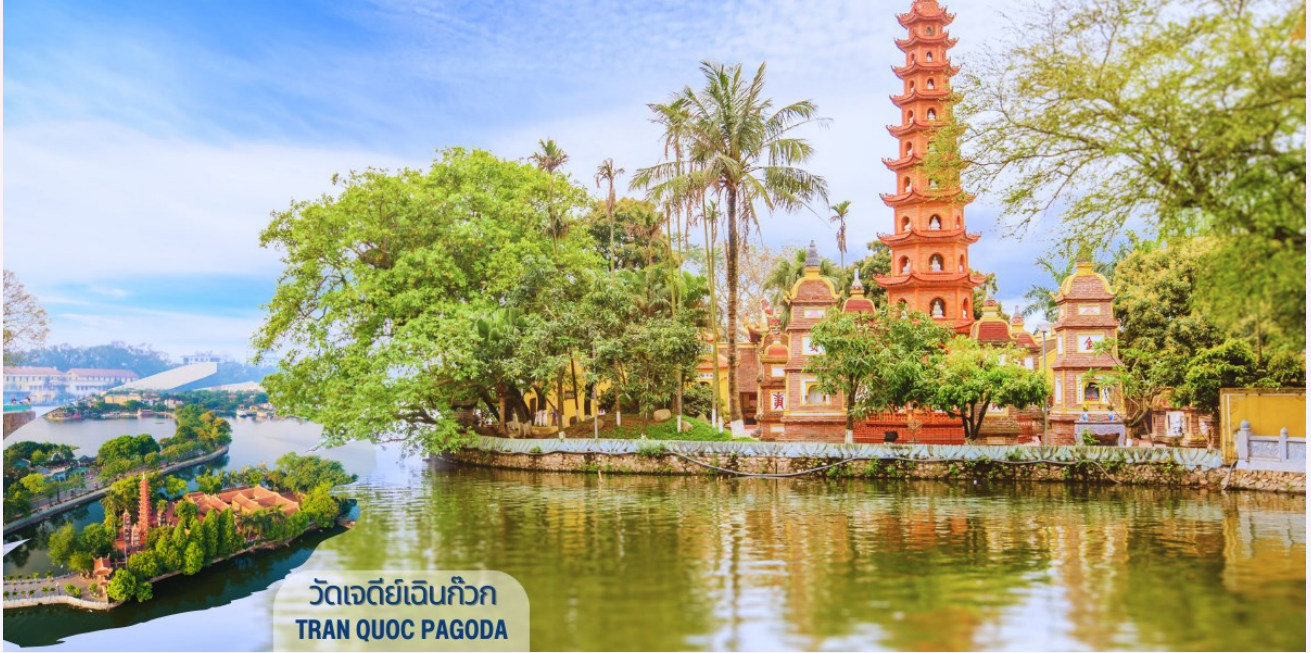
วัดเจดีย์เงินก๊ก TRAN QUOC PAGODA

นำท่านถ่ายรูปด้านหน้า สุสานโฮจิมินห์ (HO CHI MINH MAUSOLEUM) ตั้งอยู่ที่จัตุรัสบาสติงห์ เคยเป็นที่ที่ลุงโฮได้อ่านคำประกาศอิสรภาพเวียดนามจากประเทศฝรั่งเศสต่อหน้าชาวเวียดนามที่มาชุมนุมกัน เมื่อวันที่ 02 กันยายน ค.ศ.1945 สุสานนี้สร้างด้วยหินอ่อน หินแกรนิตและไม้มีค่าจากทั่วประเทศ สร้างขึ้นเมื่อปี ค.ศ. 1973 หลังจากลุงโฮเสียชีวิต เมื่อวันที่ 02 กันยายน ค.ศ.1969