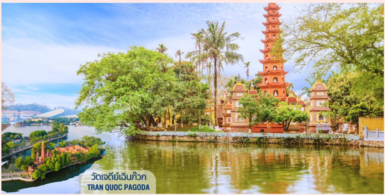
วัดเจดีย์เงินก๊วก TRAN QUOC PAGODA

พระพุทธรูป อมิตาภพุทธเจ้า ตามความเชื่อของพุทธมหายาน ซึ่งมองเห็นเด่นชัดจากภายนอก ไล่เรียงขึ้นไปตรงกัน ตัวเจดีย์ก่อสร้างด้วยอิฐสีแดง โข่วให้เห็นการซ้อนของอิฐ ชั้นล่างด้านหน้าจะมีแท่นสำหรับให้นักท่องเที่ยวบูชา ภายในมีจารึกประวัติความเป็นมาทั้งของเจดีย์และพระศรีศากยมุนีปางปริณิพพานที่ทำด้วยทองคำ