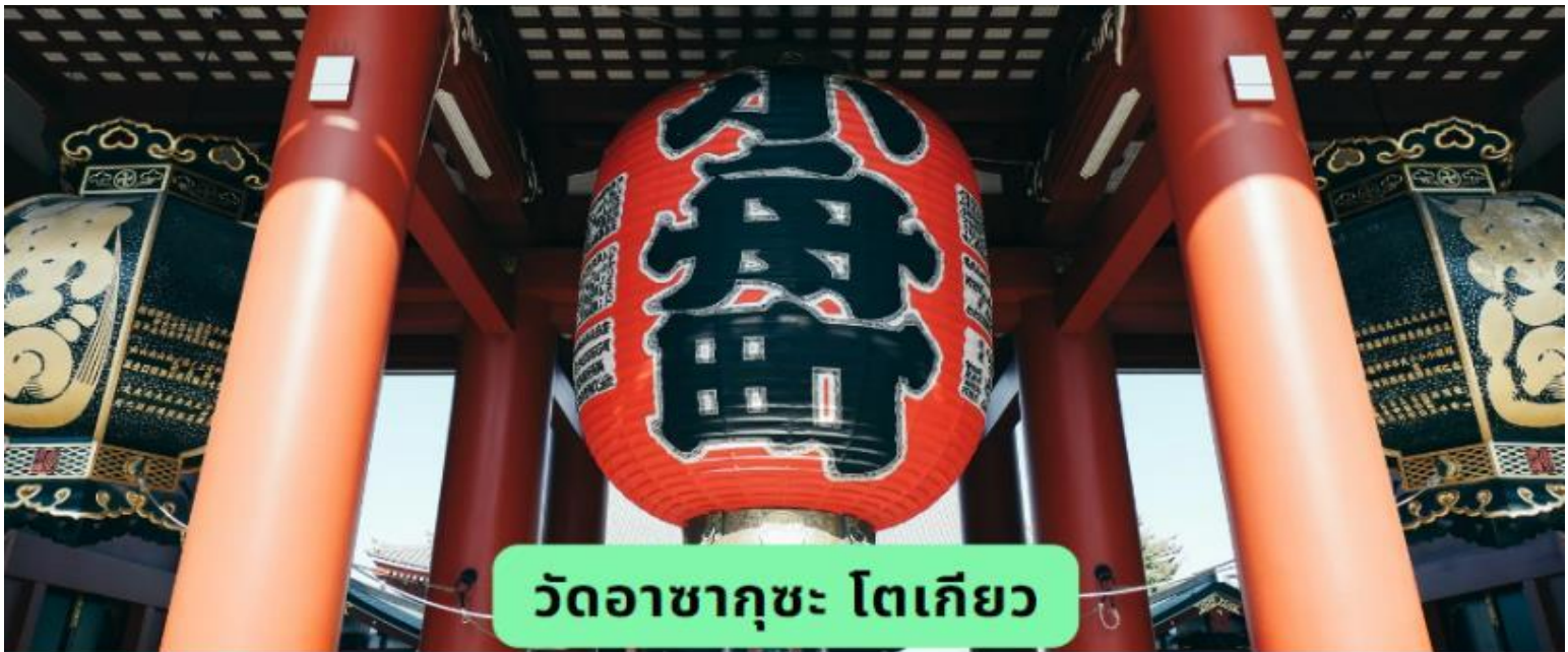
วัดอาซากุสะ โตเกียว