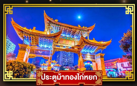
ประตูม้าทองโก่ทงหยก