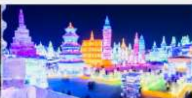
เทศกาลคอมไฟน้ำแข็ง