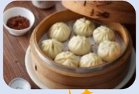
เที่ยง บริการอาหารกลางวัน ณ ภัตตาคาร เมนูพิเศษ!! เสียวหลงเปา (5)

นำท่านนมัสการ วัดหลงซาน (Longshan Temple) เป็นวัดที่เก่าแก่และมีชื่อเสียงของคนไต้หวัน วัดแห่งนี้มีอายุราวๆ เกือบ 300 ปี ด้านหน้าตกแต่งด้วยเสามังกรทั้งซ้ายและขวา เปรียบเสมือนกำลังปกป้องห้องโถงกลาง ในปี ค.ศ. 1740 เกิดความเสียหายครั้งใหญ่ทางวัดจึงได้รับการบูรณะหลายครั้ง ทั้งบานประตู คาน หลังคา และเสามังกรแกะสลักตระหง่านสวยงาม เป็นประติมากรรมที่มีความละเอียดอ่อนเป็นงานไม้ที่สวยงาม มีหนังสือจีนโบราณประดับตรงทางเข้าให้ความสัมผัสของวรรณกรรมนอกเหนือจากคุณค่าทางศาสนายังส่งเสริมการท่องเที่ยวอีกด้วย ปัจจุบันเป็นที่นิยมมาขอพรเรื่องการทำงาน การเรียน ที่สำคัญเรื่องความรัก เชื่อกันว่าใครที่ไม่ประสบความสำเร็จเรื่องความรัก ให้ขอพรกับเทพเจ้าจันทราที่วัดแห่งนี้แล้วความรักจะกลับมามีขึ้น