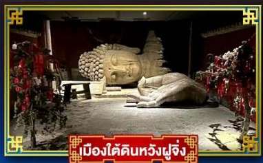
เมืองใต้ดินหวู่โจว

“กำแพงหินลี่”...สิ่งมหัศจรรย์ของโลก พระราชวังต้องห้าม อดีตพระราชวังหลวงสุดยิ่งใหญ่