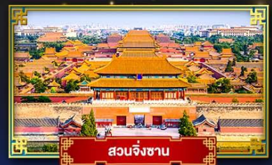
สวนจิงซาน