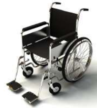
การรับบริการดูแลเป็นพิเศษ

กรณีผู้เดินทางต้องการความช่วยเหลือเป็นพิเศษ อาทิเช่น การใช้วีลแชร์ กรุณาแจ้งบริษัทฯ อย่างน้อย 7 วันก่อนการเดินทาง มิฉะนั้นบริษัทฯ จะไม่สามารถจัดการล่วงหน้าได้ เนื่องจากการขอใช้วีลแชร์ในสนามบินนั้น ต้องมีขั้นตอนในการขอล่วงหน้า และบางสายการบินอาจมีการเรียกเก็บค่าใช้จ่ายทั้งทางสนามบิน ในไทยและในต่างประเทศ ซึ่งผู้เดินทางสามารถสอบถามกับเจ้าหน้าที่ได้โดยตรงก่อนทำการจอง และหากใน คณะของท่านมีผู้ต้องการดูแลพิเศษ เช่น ผู้ที่นั่งรถเข็น (Wheelchair), เด็ก, ผู้สูงอายุและผู้ที่มีโรคประจำตัว หรือไม่สะดวกในการเดินทางท่องเที่ยวในระยะเวลายาวเกินกว่า 4 - 5 ชั่วโมงติดต่อกัน ท่านและครอบครัวต้อง ให้การดูแลสมาชิกภายในครอบครัวของท่านเอง เนื่องจากการเดินทางเป็นหมู่คณะ หัวหน้าทัวร์มีความ จำเป็นต้องดูแลคณะทัวร์ทั้งหมด