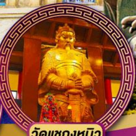
วัดเขangkหมิว