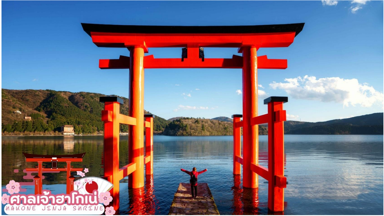
ศาลเจ้าฮาโกเน่ HAKONE JINJA SHRINE

ล่องเรือทะเลสาบอาชิ (Lake Ashi Hakone Cruise) ท่านจะได้สัมผัสประสบการณ์แปลกใหม่ล่องเรือโจรสลัดเรือต้นแบบจากการ์ตูนดังของญี่ปุ่น One Piece ชมบรรยากาศธรรมชาติ ที่ศึนียภาพที่สวยงามของทะเลสาบน้ำจืดขนาดใหญ่ที่เกิดจากการระเบิดของภูเขาไฟ