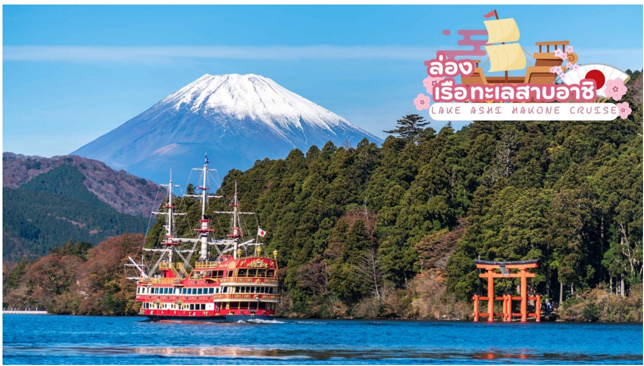
ล่องเรือทะเลสาบอาชิ LAKE ASHI HAKONE CRUISE

ล่องเรือทะเลสาบอาชิ (Lake Ashi Hakone Cruise) ท่านจะได้สัมผัสประสบการณ์แปลกใหม่ล่องเรือโจรสลัดเรือต้นแบบจากการ์ตูนดังของญี่ปุ่น One Piece ชมบรรยากาศธรรมชาติ ที่ศึนียภาพที่สวยงามของทะเลสาบน้ำจืดขนาดใหญ่ที่เกิดจากการระเบิดของภูเขาไฟ