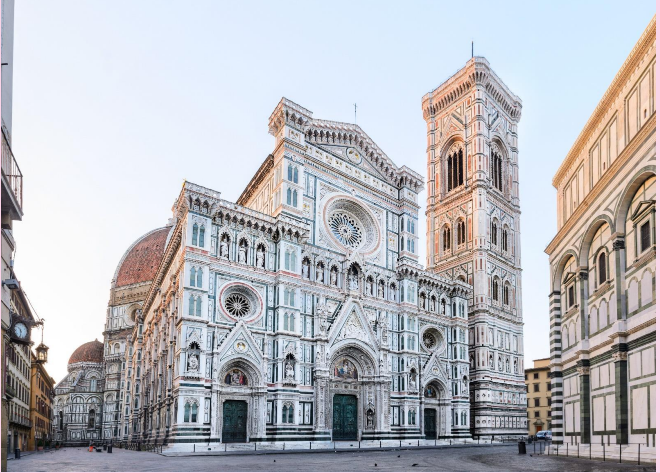
VMUCMP107SV-8 โรแมนติกแบบตะโคน Hallstatt Dolomites Venice Florence Pisa DE AT IT 10 วัน 7 คืน BY SV (Mar-Apr 25)