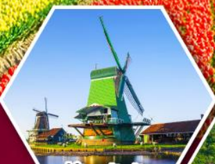
หมู่บ้านกังหันลม ชาบัสคินส์