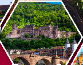
ไฮเดลเบิร์ก