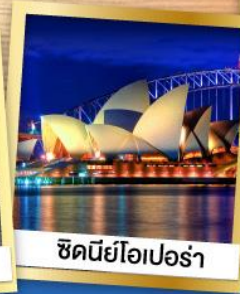
ซิดนีย์โอเปอร์รา