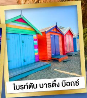
โบรด์ตัน บาร์ตัง บ็อกซ์