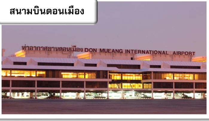
สนามบินดอนเมือง

เวลา 09.00น.พร้อมกันที่ สนามบินดอนเมือง อาคารผู้โดยสารขาออกระหว่างประเทศคอนันเตอร์ สายการบินบินไทยแอร์เอเชียเอ็กซ์เจ้าหน้าที่คอยให้การต้อนรับดูแลด้านเอกสาร เช็คอิน และสัมภาระในการเดินทาง