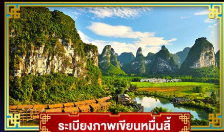
ระเบียงภาพเขียนหมื่นลี้