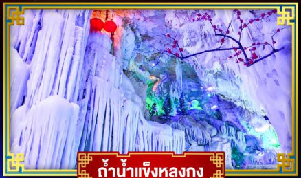
ถ้ำน้ำแข็งหลงกง

สุดอลังการ น้ำตก 2 พรหมแดน แลหลังท่องเที่ยวระดับ 5A