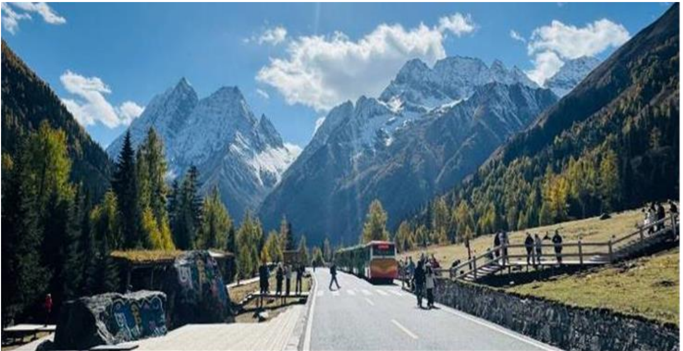
GO1TFU-TG108 เฉิงตู สี่ตรุณี ปี่ผิงโกว ต่ากู่ปิงชว่น จิวจ้ายโกว 7วัน 6คืน (นั่งรถไฟความเร็วสูง) * ไม่ลงร้านซ้อป โดยสายการบิน Thai Airways (TG)

เช้า รับประทานอาหารเช้า ณ ห้องอาหารภายในโรงแรม ( มื้อที่ 2 )