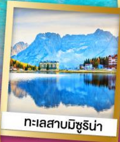
ทะเลสาบมิซูริน่า