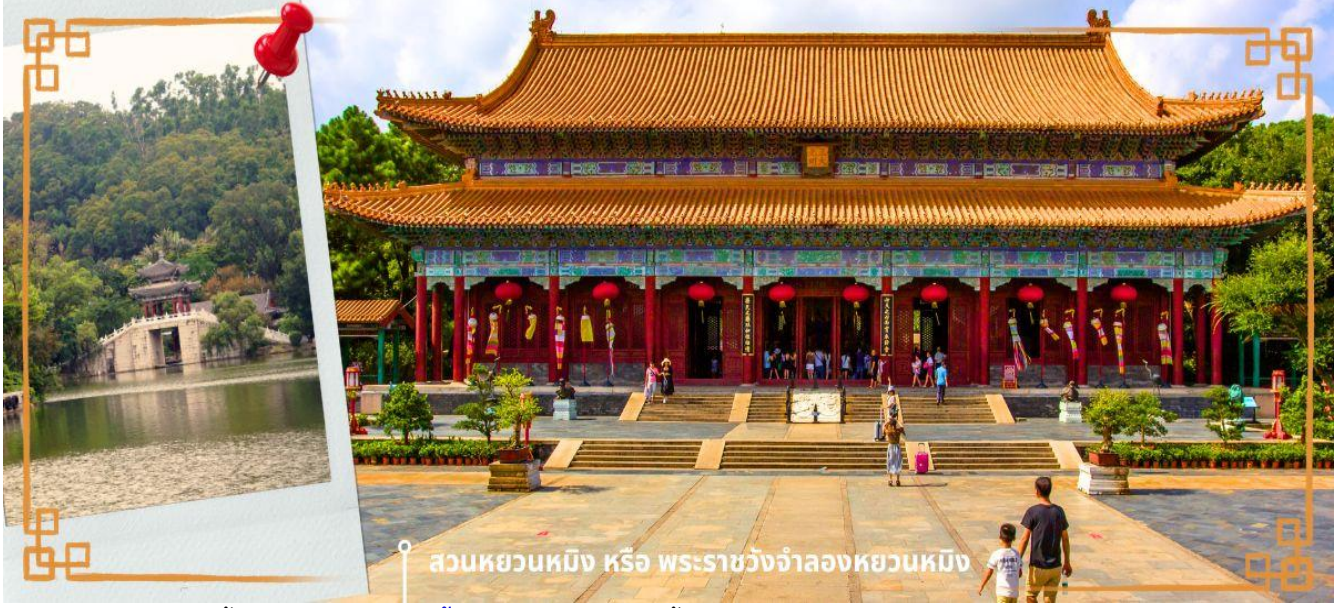
สวนหยวนหมิง หรือ พระราชวังจำลองหยวนหมิง

มีพื้นที่ครอบคลุมทะเลสาบขนาดมหึมา ซึ่งมีขนาดเท่ากับสวนเดิมในกรุงปักกิ่ง และยังมี การเพิ่มเติมและตกแต่งสวนที่เป็นศิลปะแบบตะวันตกผสมกับศิลปะจีน