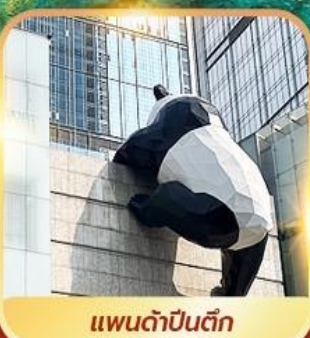
แพนด้าปีนตึก