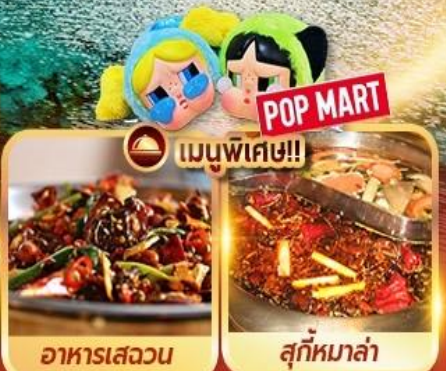
อาหารเสฉวน