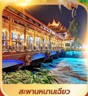
สะพานหนานเจียว