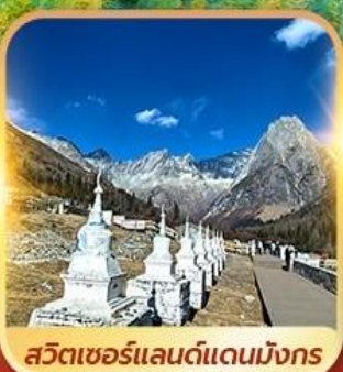
สวิตเซอร์แลนด์แดนมังกร