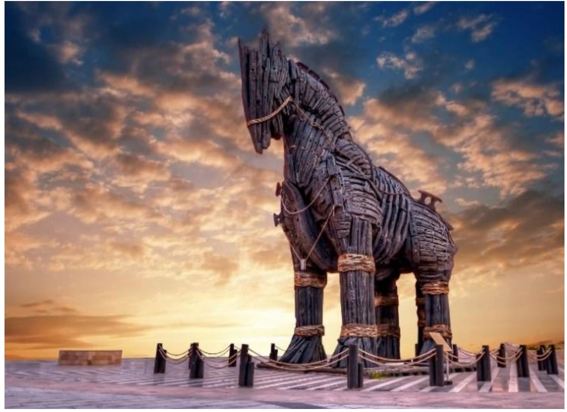
นำท่านชมและถ่ายภาพ ม้าไม้จำลองเมืองทรอยริมทะเล (TROJAN STATUE/HOLLYWOOD HORSE) เป็นม้าไม้ที่มีชื่อเสียงโด่งดังมากที่สุดจากมหากาพย์ภาพยนตร์ฮอลลีวูดเรื่อง ทรอย (Troy) ในปี 2004 มีแบรด