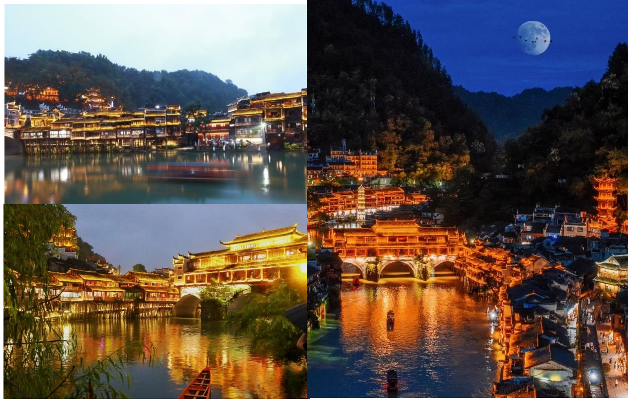
ค่ำ รับประทานอาหารค่ำ ณ ภัตตาคาร (มื้อที่ 3) จากนั้นนำท่านเดินทางเข้าสู่ที่พัก

กรณีที่มีการเมืองเฟื่องหวงปิดปรับปรุงหรืองดการล่องเรือ เนื่องจากซ่อมบำรุงหรือจากสภาพอากาศ ทั้งนี้เพื่อความ ปลอดภัยของลูกค้า ทางบริษัทฯจะจัดโปรแกรมอื่นมาทดแทนให้หรือเปลี่ยนแปลงตามความเหมาะสมอย่างใดอย่าง หนึ่ง และทางบริษัทฯ ขอสงวนสิทธิ์ไม่คืนเงินใดๆทั้งสิ้น โดยยึดตามประกาศจากทางอุทยานเป็นสำคัญโดยที่ไม่แจ้ง ให้ทราบล่วงหน้า