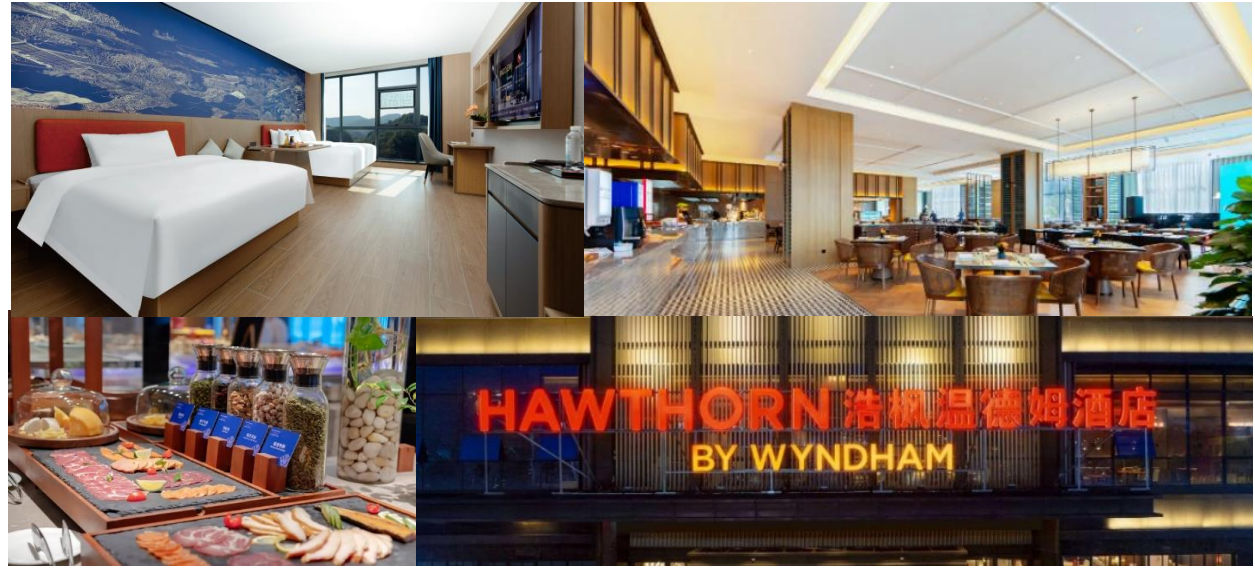
GO1CSX-VZ003- บินตรงฉางซา จางเจียเจี๋ย ชุนเซียงใหญ่และเล่นห้เมืองโบราณ 5 วัน 4 คืน โดย ไทย เวียดนาม (VZ)