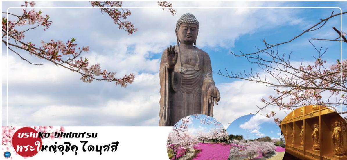
USHIKU DAIBUTSU พระใหญ่อุซึกุ ไดบุตสึ

วันที่สี่ เมืองนาริตะ – เมืองอิบารากิ – พระใหญ่อุซึกุ ไดบุตสึ – ตลาดปลาโออาริ – ศาลเจ้าโออาริโซซึกิ – เส้าโทริแห่งคามิอิโซะ – เมืองนาริตะ – อีออน มอลล์ – ท่าอากาศยานนานาชาตินาริตะ