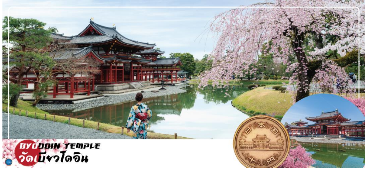
BYODOIN TEMPLE วัดเบียวโดอิน

01.15 น. เห็นฟ้าสู่ เมืองโอซาก้า ประเทศญี่ปุ่น โดยเที่ยวบินที่ XJ612 สายการบิน AIR ASIA X ใช้เครื่องบิน AIRBUS A330-300 จำนวน 377 ที่นั่ง จัดที่นั่งแบบ 3-3-3 (น้ำหนักกระเป๋า 20 กก./ท่าน หากต้องการซื้อน้ำหนักเพิ่ม ต้องเสียค่าใช้จ่าย) บริการอาหารและเครื่องดื่มบนเครื่อง(ราคาโปรโมชั่นไม่มีอาหารบนเครื่อง)