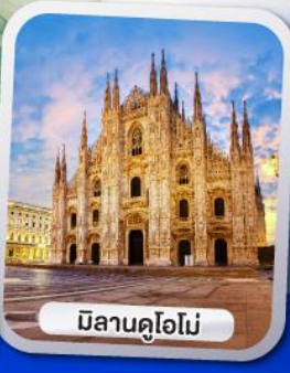
มิลานคูโอโม