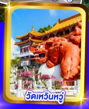
วัดเหออินหฺวู่