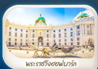
พระราชวังฮอฟบวร์ก

12-18 มี.ค.68 / 19-25 มี.ค.68 28 เม.ย. - 4 พ.ค.68 7-13 พ.ค.68