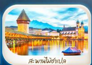
สะพานไมซ์าเปค