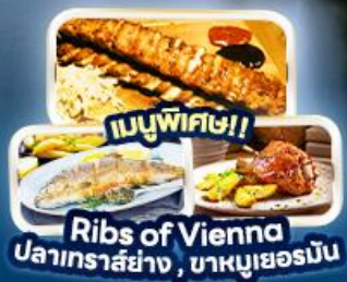
เมนูพิเศษ!! Rib of Vienna ปลาเทราลียง, หมูเยอรมัน