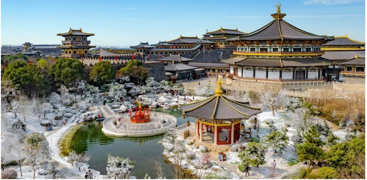
นำท่าน เที่ยวยชม เมืองจำลองราชวงศ์ถัง เมืองจำลองและสถานที่ถ่ายทำภาพยนตร์ แหล่งท่องเที่ยวระดับ AAAA ที่จำลองสภาพความเป็นอยู่ในสมัยราชวงศ์ถัง ไม่ว่าจะเป็น ตลาด กำแพงเมือง พระราชวัง วัด และอื่นๆ อีกมากมาย