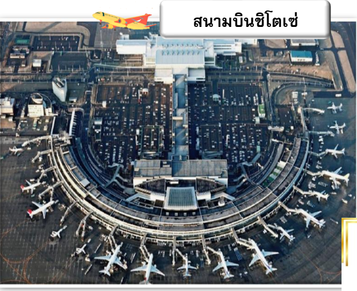
สนามบินซีโตเซ่

เวลา 02.05 น. ออกเดินทางสู่ สนามบินซีโตเซ่ ประเทศญี่ปุ่น โดยสายการบินไทยแอร์เอเชียเอ็กซ์ เที่ยวบินที่ XJ 620