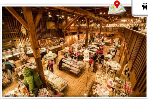
พิพิธภัณฑ์กล่องดนตรีโอตารุและหอนาฬิกาไอน้ำ

คลองโอตารุ (Otaru Canal) หรือในภาษาญี่ปุ่นเรียกว่า โอตารุอุงะ (Otaru Unga) เป็นคลองที่มีความสวยงามซึ่งไหลผ่านกลางเมืองโอตารุ เป็นแหล่งดึงดูดนักท่องเที่ยวที่สำคัญของเมืองในทุกฤดูกาล สามารถเดินเล่นริมคลองและมีบริการล่องเรือในคลองอีกด้วย ส่วนบริเวณริมคลองตกแต่งด้วยคอมไฟสไตล์วิคตอเรียนและมีอาคารโกดังที่สร้างจากอิฐเป็นแนวยาวไปตามคลอง ซึ่งในสมัยก่อนใช้เป็นโกดังสินค้าและในปัจจุบันได้กลายมาเป็นร้านอาหาร ทำให้ได้บรรยากาศโรแมนติกมาก ๆ ในช่วงเดือนกุมภาพันธ์ของทุกปียังใช้เป็นหนึ่งในสถานที่จัดงานเทศกาลหิมะช่วงหน้าหนาวซึ่งจะมีการประดับตกแต่งด้วยคอมไฟทั่วมือง