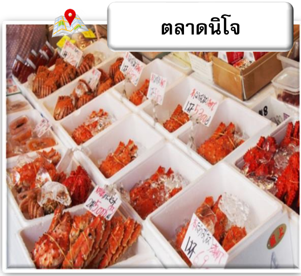
ตลาดนิจิโจ

ตลาดนิจิโจ มีประวัติศาสตร์ยาวนานกว่า 100 ปี เปรียบเสมือนห้องครัวของชาวเมืองซัปโปโรมาตั้งแต่สมัยก่อน นอกจากปลาแซลมอน ปู และหอยเชลล์ที่เป็นอาหารทะเลเด่นๆ ของฮอกไกโดแล้ว ยังเต็มไปด้วยผลผลิตทางการเกษตรอย่างผลไม้และผักนานาชนิด นับเป็นตลาดที่ขาดไม่ได้สำหรับชาวเมืองซัปโปโรเลยทีเดียว ที่ตลาดนิจิโจในปัจจุบัน นอกจากจะมีร้านที่เปิดกิจการต่อเนื่องมาหลายสิบปี ก็ยังมีร้านที่เพิ่งเปิดใหม่ และบริเวณรอบๆ ก็มีร้านอิซากายะ (ร้านเหล้า) และร้านอาหารที่มีเอกลักษณ์เฉพาะตัวเพิ่มมากขึ้น ที่นี่จึงกลายเป็นสถานที่ท่องเที่ยวยอดนิยมที่สามารถมาทานอาหารทะเลสดๆ ก็ได้ มาเลือกซื้อของฝากก็ได้