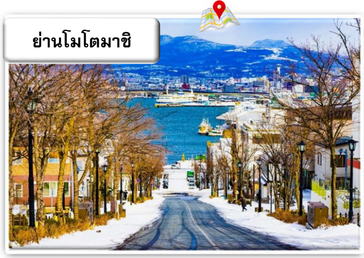
ย่านโมโตมาชิ

ย่านเมืองเก่าโมโตมาชิ (Motomachi District) หรือมีชื่อเรียกอีกอย่างว่า ท่าเรือเมืองฮาโกดาเตะ ตั้งอยู่ที่เมืองฮาโกดาเตะ (Hakodate) ภายในจังหวัดฮอกไกโด (Hokkaido) ย่านนี้นับเป็นย่านที่มีประวัติยาวนานเป็นร้อยปี แลมีสิ่งปลูกสร้างต่าง ๆ ก็ยังคงมีการอนุรักษ์ไว้อย่างดีเยี่ยม แม้ภายหลังจะมีบางแห่งที่มีการปรับเปลี่ยนเป็นอย่างอื่นบ้าง หากด้านนอกก็ยังคงรักษาสถาปัตยกรรมแบบดั้งเดิมไว้อย่างดีงาม