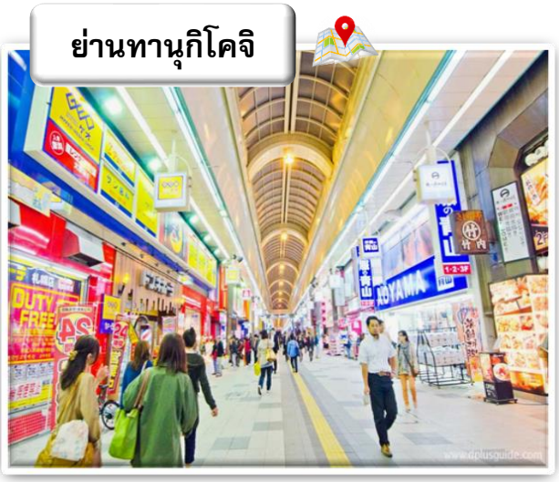
ย่านทานุกิโคจิ

ย่านทานุกิโคจิ (Tanuki Koji) ถือว่าเป็นย่านซูปป์ชื่อดังของเมืองซัปโปโร เป็นแหล่งซูปป์ในร่มที่มีหลังคาคลุมยาวตามแนวถนน ยาว 1 กิโลเมตร หรือประมาณ 7-8 บล็อก จนถึงแม่น้ำ Sosei ที่นี้เปิดมานานเป็นร้อยปี นับว่าเป็นตลาดเก่าแก่ที่เปิดตั้งแต่ปี ค.ศ. 1873 โดยสองข้างทางเต็มไปด้วยร้านค้ากว่า 200 ร้าน ทั้ง ร้านขายของที่ระลึก ขนม ของเล่น เครื่องสำอาง ซ็อคโกแลต เสื้อผ้า ข้าวของเครื่องใช้ต่างๆ และร้านอาหารให้เลือกรับประทานมากมาย