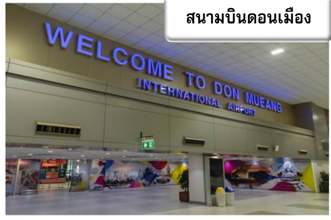
สนามบินดอนเมือง

เวลา 22.00 น. พร้อมกันที่ ท่าอากาศยานดอนเมือง อาคารผู้โดยสารขาออกระหว่างประเทศ เคาน์เตอร์สายการบินไทยแอร์เอเชียเอ็กซ์ เจ้าหน้าที่คอยให้การต้อนรับ ดูแลด้านเอกสาร เช็คอิน และสัมภาระในการเดินทาง