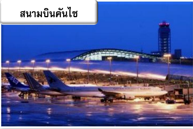
สนามบินคันไซ

เวลา 01.00 น. ออกเดินทางสู่ สนามบินคันไซ ประเทศญี่ปุ่น โดยสายการบินไทยแอร์เอเชียเอ็กซ์ เที่ยวบินที่ XJ 612 เวลา 08.50 น. เดินทางถึง สนามบินคันไซ ประเทศญี่ปุ่น นำท่านผ่านขั้นตอนการตรวจคนเข้าเมืองและศุลกากร เวลาญี่ปุ่น เร็วกว่าประเทศไทย 2 ชั่วโมง