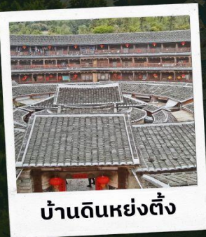
บ้านดินหย่งตั้ง