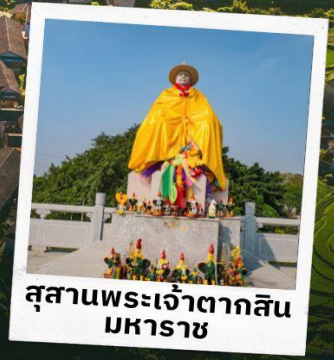
สุสานพระเจ้าตากสิน มหาราช