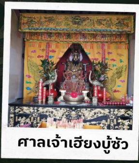
ศาลเจ้าเฮียงบู๊ซัว