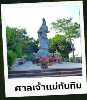
ศาลเจ้าแม่ทับทิม