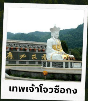
เทพเจ้าโจวซ็อกง