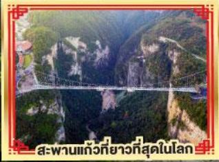
สะพานแกว่งที่ยาวที่สุดในโลก