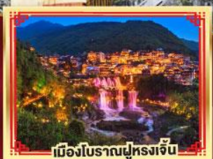
เมืองโบราณฟูหลงจิ้น