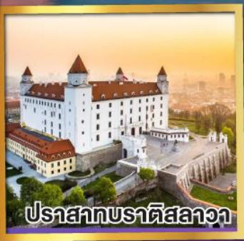
ปราสาทบราติสลาวา