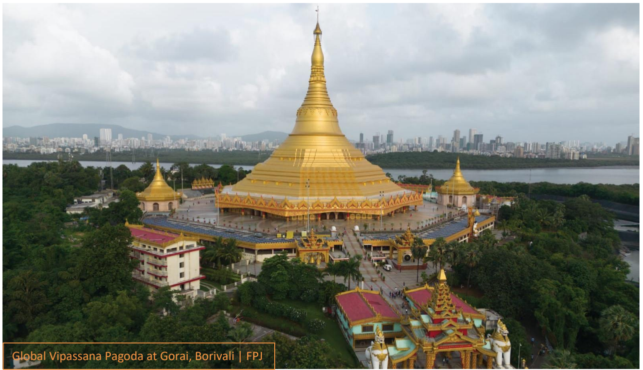
Global Vipassana Pagoda at Gorai, Borivali