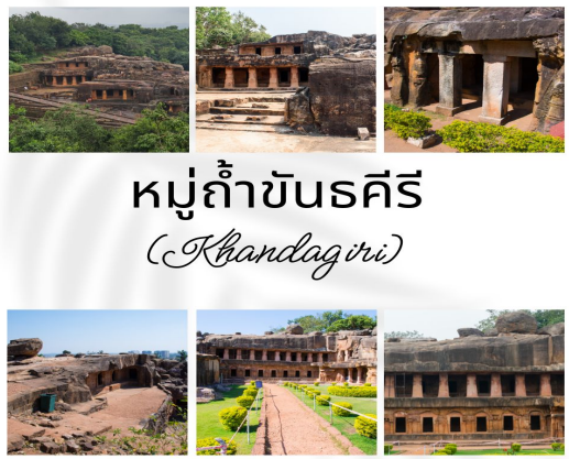
หมู่ถ้ำขันธคีรี (Khandagiri)

07.00 น. รับประทานอาหารเช้า(7)ที่ ห้องอาหารของโรงแรม นำท่านชม ภูวนศวร(Bhubaneswar) เมืองหลวงแห่งรัฐโอริศา หรือ แคว้นกาลิงคะในสมัยพุทธกาล ซึ่งเป็นสถานที่ พระเจ้าอโศกมหาราชทางเปลี่ยนศาสนา เมื่อพระเจ้าอโศกมหาราชได้เปลี่ยนการนับถือศาสนา จากฮินดูมาเป็นศาสนาพุทธนั้น ทำให้ศาสนาพุทธเข้ามาสู่ยุครุ่งเรืองสูงสุด มีการก่อสร้างเทวสถาน พระพุทธรูป รวมไปถึงการเผยแพร่ศาสนาไปทั่วทั้งชมพูทวีป รวมไปถึงการส่งศาสนาพุทธมายังดินแดนต่างๆ สุวรรณภูมิ จีน ศรีลังกา มองโกเลีย เอเชียกลาง อิหร่าน อียิปต์ นำท่านชม หมู่ถ้ำขันธคีรีและอุทัยคีรี (Khandagiri & Udaygiri) ซึ่งถือว่าเป็นหมู่ถ้ำศาสนาเซน ที่เป็นสถาปัตยกรรมแบบหินตัด และเจาะเข้าไปในภูเขา ซึ่งกินพื้นที่ภูเขา 2 ลูกคือ ขันธคีรีและอุทัยคีรี หมู่ถ้ำเหล่านี้ถูกแบ่งออกเป็น 2 กลุ่ม โดยแบ่งจาก