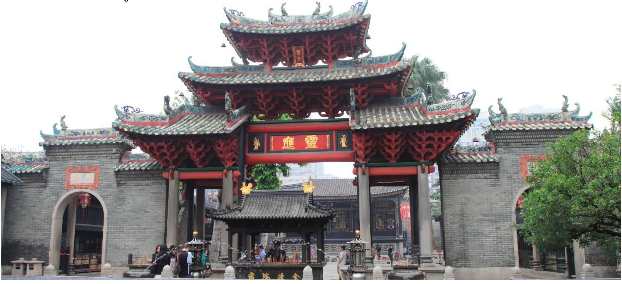
นำท่าน ชมการแสดงเชิดสิงโต ของสำนักการเชิดสิงโตและศิลปะการต่อสู้ด้ารับหวงเฟยหง

นำท่านเดินทางสู่ วัดจุฬามิยา วัดในลัทธิเต๋าซึ่งเป็นวัดเก่าแก่คู่บ้านคูเมืองของฝอซานมากกว่า 700 ปี สร้างขึ้นในราชวงศ์หมิง เมื่อปี ค.ศ.1372 ภายในวัดนั้นมีเทพเสียนอู่ตี้ หรือเทพเจ้าเหนือ (God of the North) เป็นประธานของวัด และมีวิหารเขียนต่างๆ โดยบนหลังคาของวัดนั้นจะประดับประดาไปด้วยรูปปั้นตุ๊กตาเซรามิคขนาดเล็กๆอยู่เต็มไปหมด นั่นก็คือผลิตผลอันมีชื่อเสียงของเมืองฝอซาน และหากเอ่ยถึงเมืองฝอซานก็ทำให้นึกถึงปรมาจารย์ด้านกังฟูอันมีชื่อเสียงที่มีบ้านเกิดอยู่ที่เมืองแห่งนี้ คือ "หวงเฟยหง" ปรมาจารย์กังฟูที่มีตัวตนจริงในประวัติศาสตร์ เป็นบุคคลที่ได้รับการยกย่องทั้งทางด้านการเป็นจอมยุทธ์ผู้มีใจเป็นธรรม เป็นครูมวยที่ได้รับการยอมรับนับถือ และยังเป็นนักเชิดสิงโตผู้มีชื่อเสียง และอีกท่านคือ "ยิปมัน" ปรมาจารย์กังฟูที่มีชื่อเสียงอีกคนหนึ่ง ที่มีศิลปะการต่อสู้แบบ "มวยหย่งชุน" เป็นเพลงมวยที่มีเอกลักษณ์อยู่ที่ความว่องไวและหนักหน่วงในการต่อสู้แบบประชิดตัว ซึ่งเรื่องราวของเขาทั้งสองได้รับการนำมาถ่ายทอดเป็นนวนิยายและถูกสร้างเป็นภาพยนตร์มาแล้วนับไม่ถ้วน จนเป็นที่รู้จักและโด่งดังไปทั่วโลก