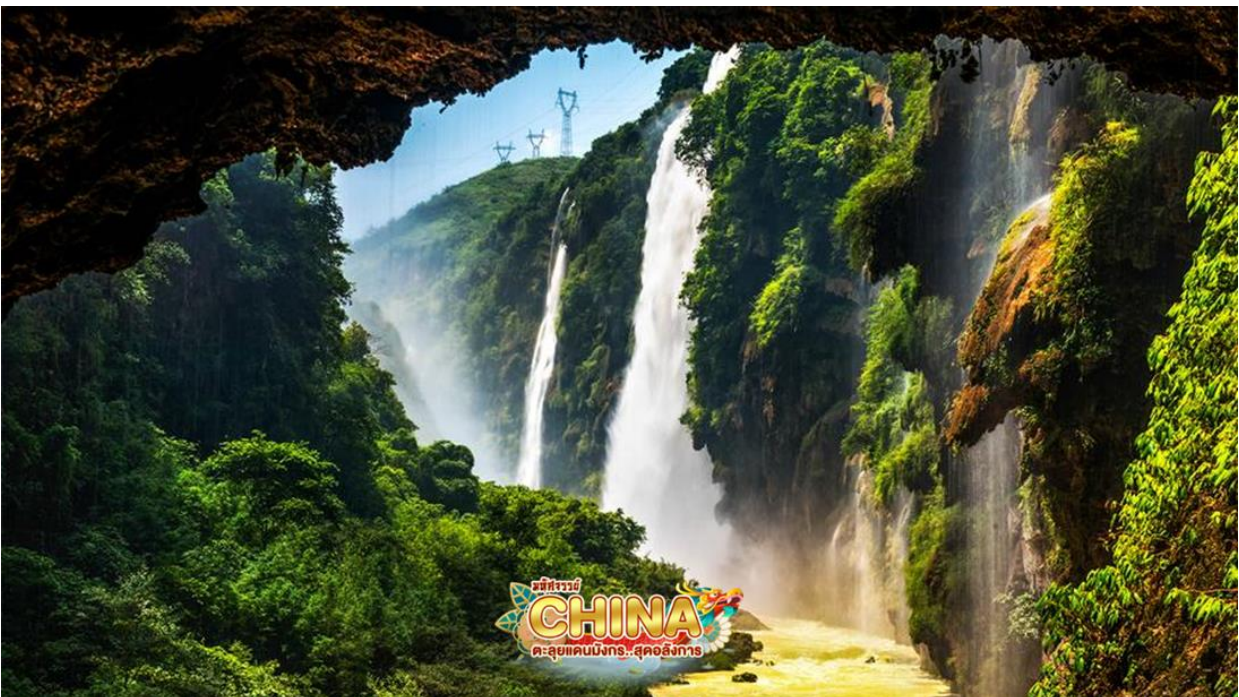
** หมายเหตุ: ปริมาณน้ำตก ขึ้นอยู่กับสภาพอากาศในแต่ละฤดูกาล **

เดินทางไปยัง หุบเหวน้ำตกร้อยสาย หุบเหวน้ำตกที่มีความสวยงาม แหล่งท่องเที่ยวที่สวยงามอีกแห่งของประเทศจีน นอกจากจะได้ชมธารน้ำตกที่ไหลลงมาจากหน้าผาสูงชันแล้ว ยังสามารถเดินเลียบลำธารเพื่อศึกษาและตีความไปกับธรรมชาติที่ยังสมบูรณ์ และชมปรากฏการณ์ทางธรรมชาติที่สวยงาม รอยแยกหม่าหลิงเหอ สถานที่ชมวิวดูอลังการที่จะได้เห็นทั้งผืนป่าที่แสนกว้างใหญ่ และหุบเขาเรียงกันสลับซับซ้อน รวมไปถึงน้ำตกจากผาสูงชันที่สวยงามราวกับอยู่ในจีนภาพ (รวมรถราง)