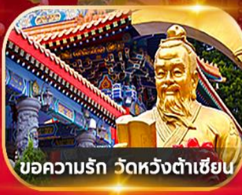
ขอความรัก วัดหวังต้าเซียน