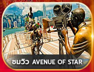
ชมวิว AVENUE OF STAR