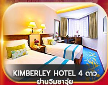
KIMBERLEY HOTEL 4 ดาว ย่านจิมซาจุ่ย