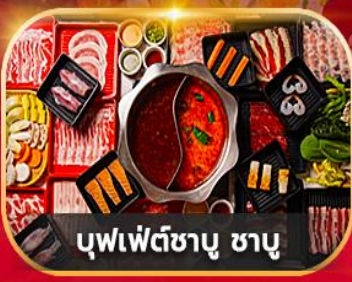
บุฟเฟ่ต์ชาบู ชาบู