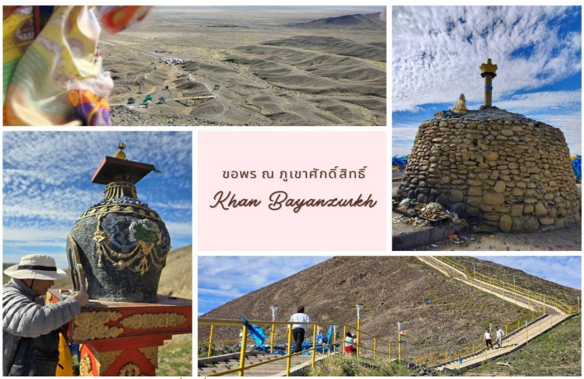
ขอพร ณ ภูเขาศักดิ์สิทธิ์ Khan Bayanzurkh

บ่าย นำท่านเดินทางไปขอพร ณ ภูเขาศักดิ์สิทธิ์ “Khan Bayanzurkh/ข่านบายันซูร์” คนในท้องถิ่นเรียกมันว่า Wishing Black Mountain เพราะมีความเชื่อว่าหากคุณปีนขึ้นไปบนยอดเขาและกระซิบคำอธิษฐาน ภูเขาก็ตอบสนองความปรารถนาของผู้ขอพร ปัจจุบันผู้คนจำนวนมากนิยมมาเพื่อขอพรภูเขาศักดิ์สิทธิ์ตลอดทั้งปี แต่มีเพียงผู้ชายเท่านั้นที่