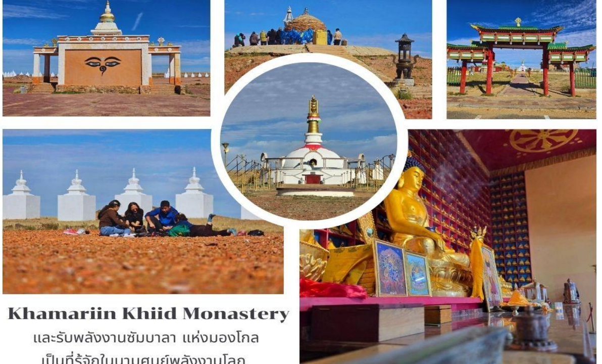
Khamariin Khiid Monastery และรับพลังงานซัมบาลา แห่งมองโกล เป็นที่รู้จักในนามศูนย์พลังงานโลก

สถานที่นี้มีความเชื่อว่า เมื่อคุณก้าวเดินเข้ามา แล้วเดินกลับออกไปจากที่นี่ เสมือนคุณได้เกิดใหม่ หรือได้เริ่มต้นสิ่งใหม่ๆ