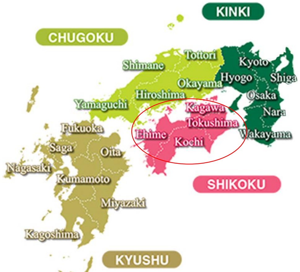
จังหวัด คางาวะ (KAGAWA) ตั้งอยู่บนเกาะชิโกกุ (SHIKOKU) 1 ใน 4 เกาะหลักของญี่ปุ่น