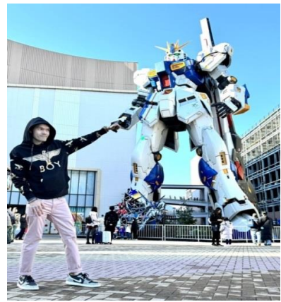
หุ่นกันดั้ม ชื่อ RX93 FF Nu Gundam

📍 รับประทานอาหารกลางวัน ณ ภัตตาคาร เดินทางต่อไปยัง ร้านค้า DUTY FREE ให้ท่านได้ช้อปปิ้งสินค้าปลอดภาษีที่มีคุณภาพ อาทิ เครื่องสำอาง โฟมล้างหน้า(แนะนำ) อาหารเสริม ขนม เครื่องใช้ต่างๆ ฯลฯ ...จากนั้นแวะ แซะรูปกับหุ่นกันดั้มยักษ์ ณ ห้าง LaLaport (หากมีเวลาพอ) มีขนาดใหญ่กว่า Unicorn Gundam ที่โตเกียวและใหญ่กว่า RX93 FF Gundam ที่ Gundam Factory Yokohama เรียกได้ว่าเป็นแลนด์มาร์คสำคัญของเมืองฟูกูโอกะในปัจจุบัน ...จากนั้นอิสระให้ท่านช้อปปิ้ง ย่านเทนจิน (Tenjin) หรือ ย่านฮากาตะ (Hakata) เป็นย่านช้อปปิ้งขนาดใหญ่ใจกลางเมือง รวบรวมแหล่งบันเทิง อย่างครบครัน ไม่ว่าจะเป็นตึกต้นไม้ ร้านค้าที่น่าสนใจ และบรรยากาศสุดคลาสสิก หรือจะเป็นย่านของกินอร่อยๆ อย่างย่านยะไต (Yatai) หมายถึง ชุมชขายอาหารที่มีขนาดไม่ใหญ่มาก ที่รวมร้านอาหารแบบฉบับท้องถิ่นเอาไว้มากมาย