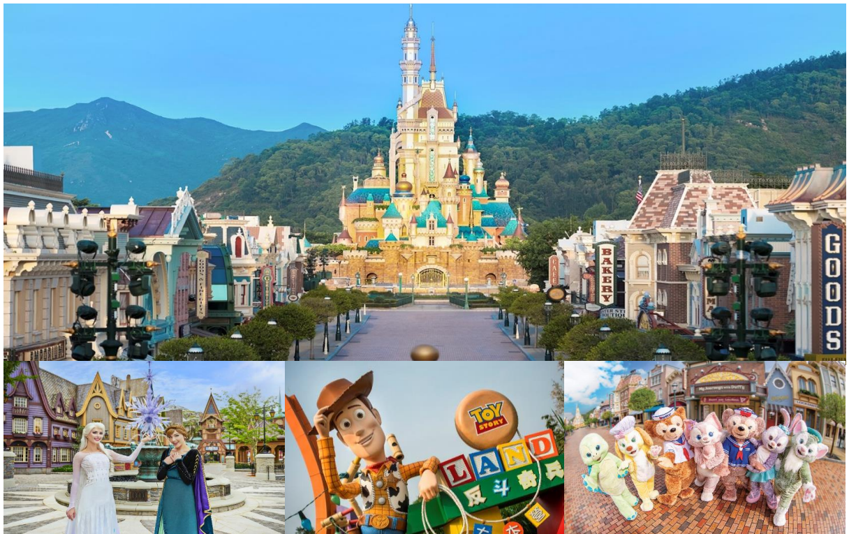
Option: Disneyland (ไม่รวมค่าเดินทาง)