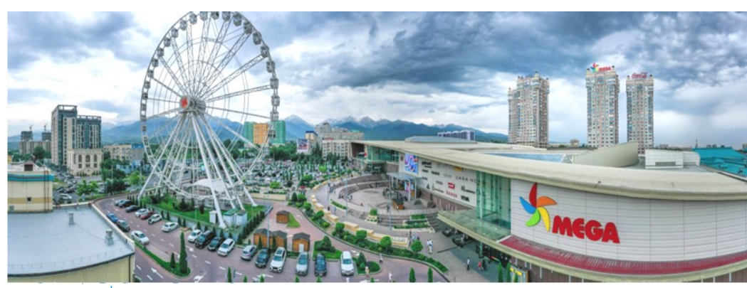
เที่ยว 2 สถาน...กับความต่างที่ลงตัว...อุซเบกิสถาน-คาซัคสถาน 8 D6N by KC on Oct- Dec 2024

(เพื่อความสะดวกในการเลือกซื้อสินค้า อีสระรับประกันอาหารค่ำภายในเมก้ามอลล์)