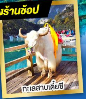
ทะเลสาบเต๋ยซี