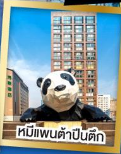
หมี่แพนต้าป็นตึก