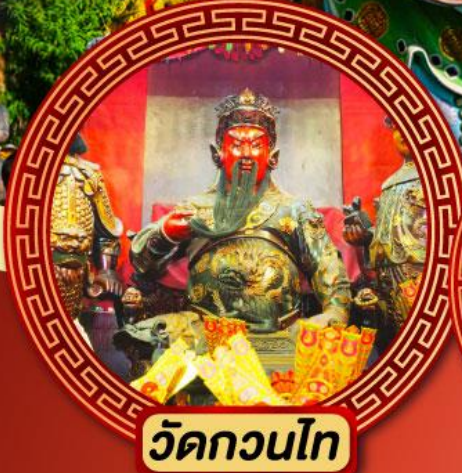
วัดกวนไท่