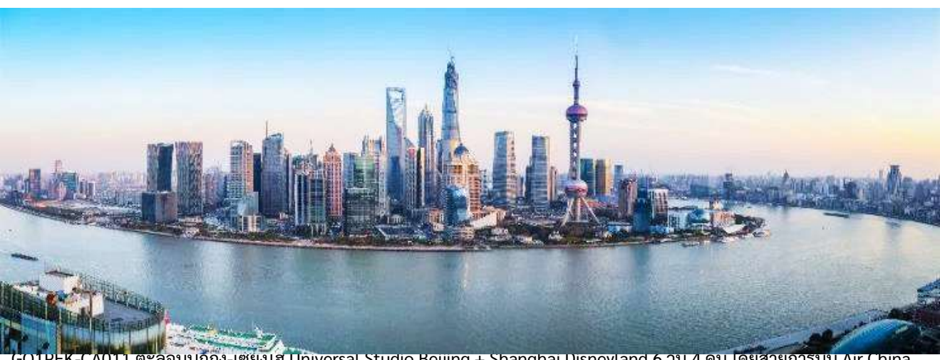
GOIPEK-CA011 ตะลอนบกก้ง-เซี่ยงไฮ้ Universal Studio Beijing + Shanghai Disneyland 6 วัน 4 คน โดยสายการบิน Air China (CA)

นำท่านสู่บริเวณ หาดไวทาน ตั้งอยู่บนฝั่งตะวันตกของแม่น้ำหวงผู้มีความยาวจากเหนือจรดใต้ถึง 4 กิโลเมตร ถือเป็นสัญลักษณ์ที่โดดเด่นของนครเซี่ยงไฮ้อีกทั้งถือเป็นศูนย์กลางทางด้านการเงินการ ธนาคารที่สำคัญแห่งหนึ่งของเซี่ยงไฮ้ตลอดแนวยาวของหาดไวทานเป็นแหล่งรวมศิลปะ สถาปัตยกรรมที่หลากหลาย เช่น สถาปัตยกรรมแบบโรมันโกธิคबारอครวมทั้งการผสมผสาน ระหว่างสถาปัตยกรรมตะวันออก-ตะวันตกเป็นที่ตั้งของหน่วยงานภาครัฐเช่น กรมศุลกากร โรงแรม และสำนักงานใหญ่ของธนาคารต่างชาติเป็นต้น